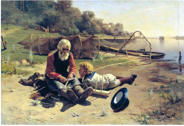
В. Перов "Дедушка и внучек"