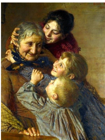
А. Красносельский "Бабушкина сказка"